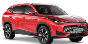
ČERVENÁ DYNAMIC* Metalická farba