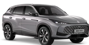
ŠEDÁ HAMPSTEAD* Metalická farba