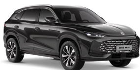
ČIERNA PEARL* Metalická farba