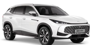
BIELA PEARL* Metalická farba