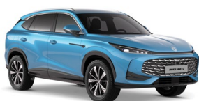
MODRÝ ARCTIC Základná farba