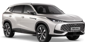
STRIEBORNÁ STERLING* Metalická farba